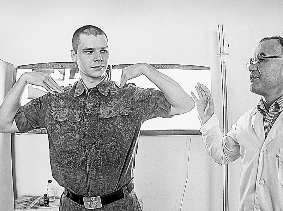
ЗДОРОВЬЕ Призывники войдут в число главных адресатов регионального календаря прививок.