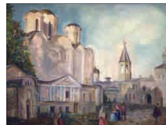
Новгородский торг. 2009 год