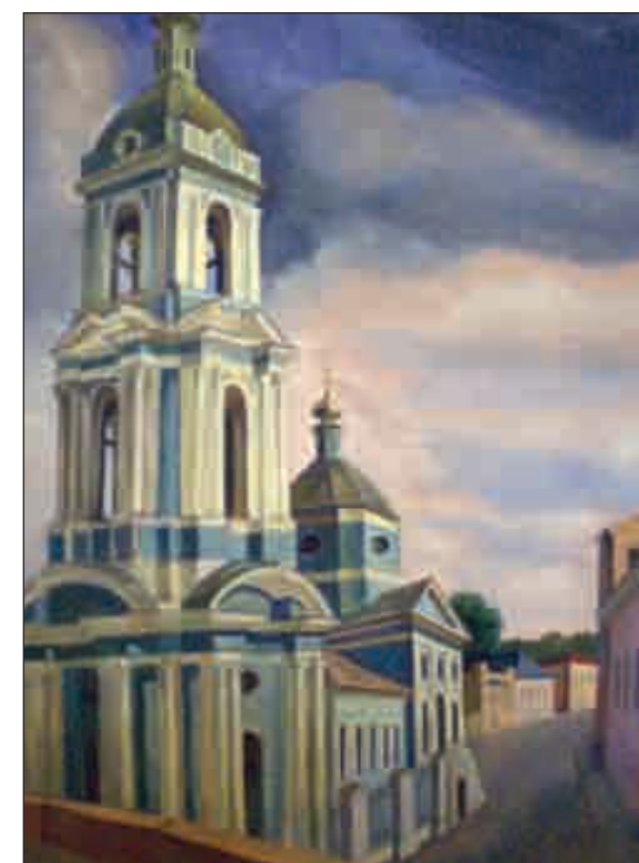
Серебрянический переулок. 2008 год