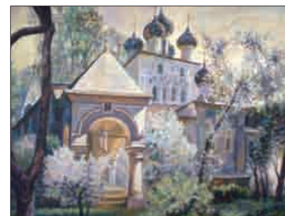
Весна (Казанский храм в Коломенском).