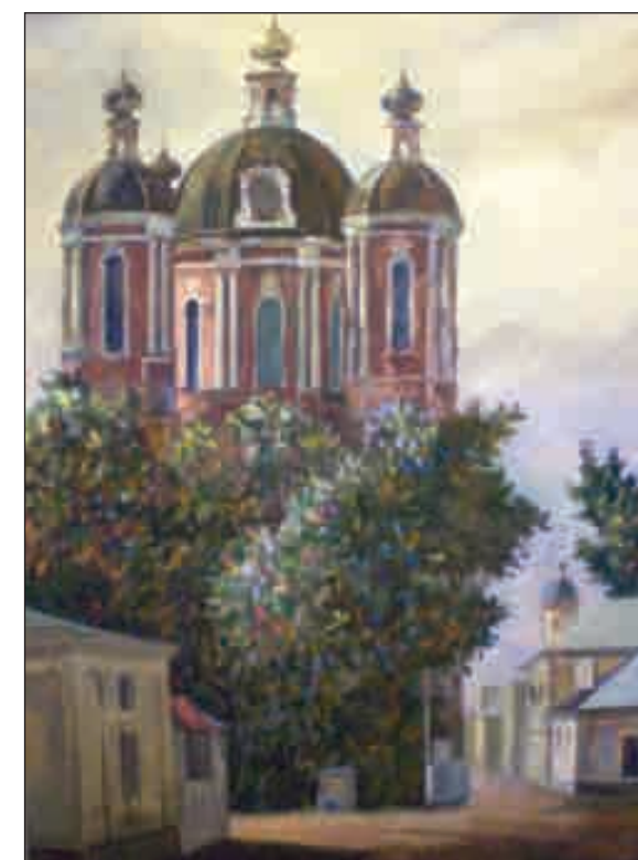
Сентябрь в Замоскворечье. 2008 год