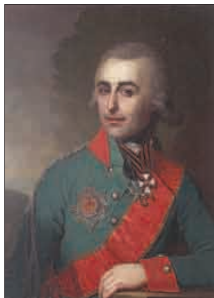
В. Л. Боровиковский. Портрет графа Петра Александровича Толстого. Холст, масло. 1799 год

В энциклопедиях годом рождения П. А. Толстого обычно указывается 1761-й. Однако из современной ему литературы следует весьма противоречивая датировка этого события. Известно такое сообщение: когда П. А. Толстой получил Георгиевский крест (1794), ему исполнилось 24 года, следовательно, он родился в 1769 или 1770 году 2 . В некрологе П. А. Толстого сообщается, что