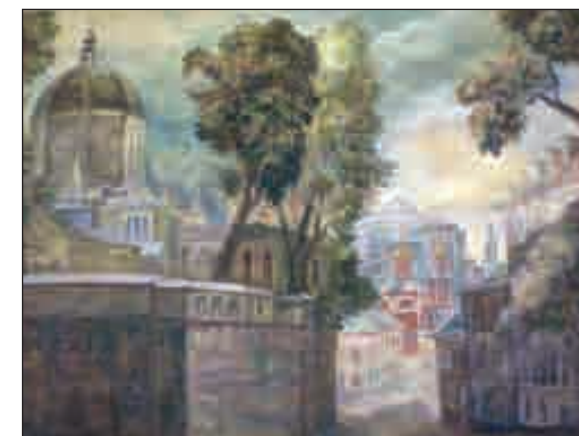
Ивановский монастырь. 2010 год