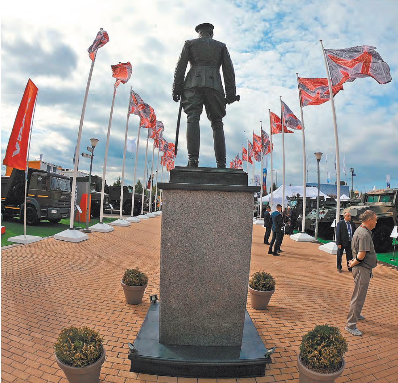
В форуме «Армия-2023» принимают участие около полутора тысяч ведущих российских предприятий оборонно-промышленного комплекса.

«Особое внимание на площадках форума уделено тематике беспилотных летательных аппаратов. Это направление