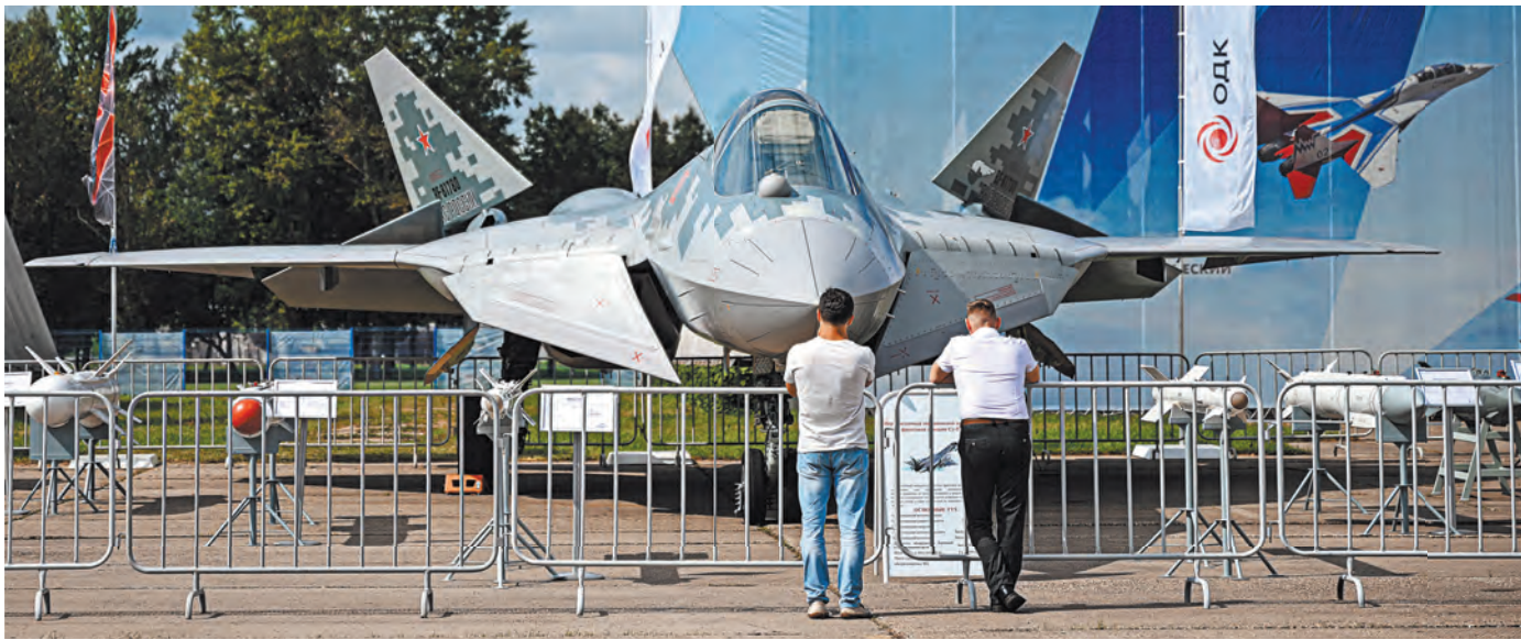
Посетители международного военно-технического форума «Армия-2023» смогут увидеть новейший истребитель 5-го поколения Су-57.

сегодня активно развивается и в военном, и в гражданском секторе. По сути, речь идет о создании новой самостоятельной наукоемкой и высокотехнологичной отрасли. И конечно, предлагаем обратить внимание на инновационную и гражданскую продукцию наших предприятий ОПК. Это катера и вертолеты, амфибии и беспилотники для самого широкого применения», — подчеркнул президент.