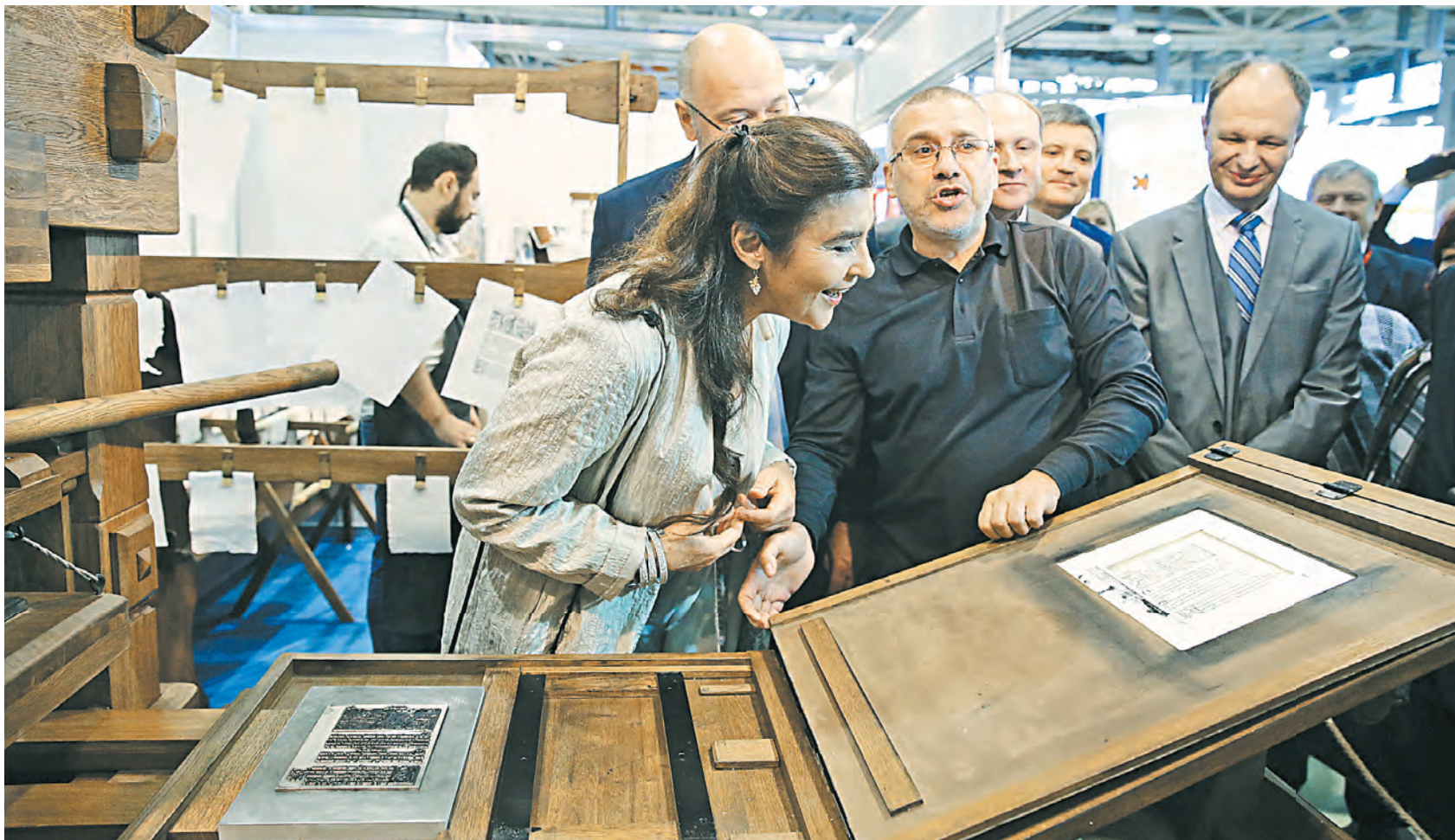
Почетные гости ярмарки на белорусском стенде узнали, как 500 лет назад Франциск Скорина печатал Библию.