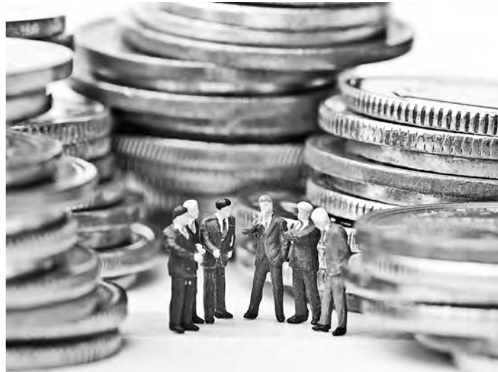
Верховный суд России объяснил, по каким признакам можно отличить чистые деньги от грязных.

Новые правовые позиции Верховного суда, как полагают практики, позволят шире применять две пока достаточно редкие статьи Уголовного кодекса. Одна наказывает тех, кто, заработав нечестным путем, отмывает для себя. Например, придает законный вид богатствам, нажитым от торговли наркотиками. Другая статья карает тех, кто так или иначе помогает преступникам делать грязные деньги чистыми. Допустим, ушлый бухгалтер с помощью хитрых схем очищает чужие грязные деньги. Или банков-