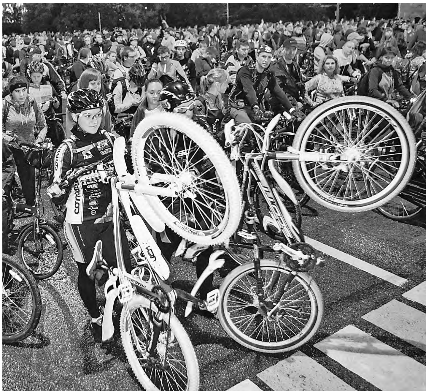
Велосипеду негде было встать: на первый велопарад в Москве собрались более 10 тысяч москвичей.

Велосипедисты такому новшеству не нарадуются. «Чувствую себя вполне европейским жителем, — признается молодой парень на спортивном велике. — Я был в Германии, Франции, Голландии, других европейских странах и везде у велосипедистов есть своя дорога. Теперь моя дорога появилась у меня и в Москве. Здесь я чувствую себя уверенно, меня не сбьют». Впро-