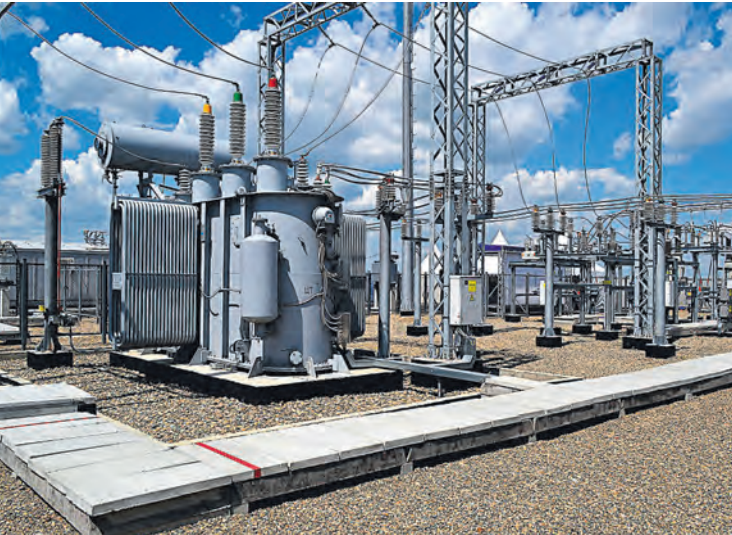
Все устанавливаемое на подстанциях оборудование – отечественного производства.

альных сетевых организаций (ТСО), которые являются собственниками электросетевых объектов и несут всю полноту ответственности за эксплуатацию своего распределительного электросетевого оборудования, а также надежность и качество энергоснабжения своих потребителей.