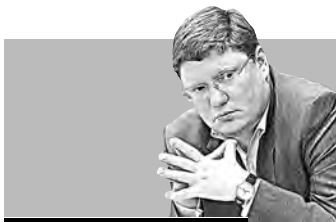
Андрей Исаев председатель Комитета Госдумы по труду, социальной политике и делам ветеранов