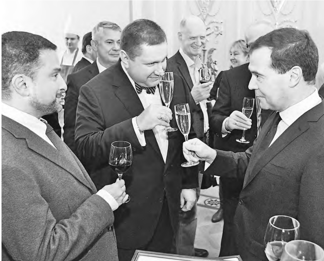
Дмитрий Медведев считает средства массовой информации влиятельной силой.

— Не открую ничего нового, если скажу, что средства массовой информации — сила влиятельная, — дал премьер общую оценку общественному медиасообществу.