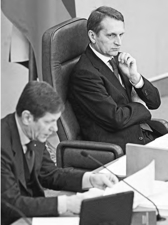
Сергей Нарышкин напомнил коллегам, что Дума шестого созыва подошла к середине своего пути.