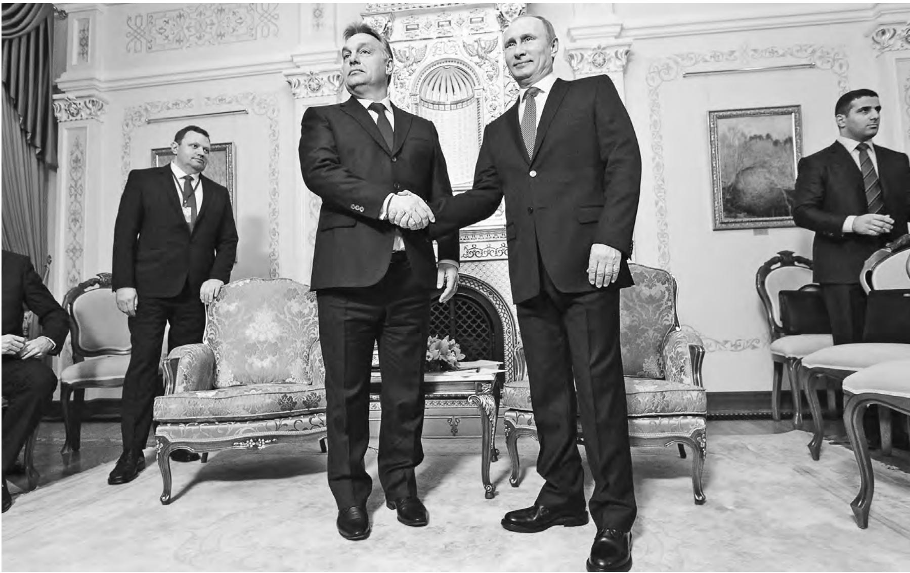
Владимир Путин вчера провел переговоры с премьер-министром Венгрии Виктором Орбаном. По словам российского президента, российско-венгерские контакты «несут деловой, регулярный характер, развиваются по всем направлениям, имея в виду экономику, межпарламентские связи, политику». «Россия — чрезвычайно важный партнер для Венгрии, могут назвать стратегическим наше экономическое взаимодействие», — отметил Орбан.

—Будем надеяться, что экономика все-таки сильно падать не будет, а будет расти», — сказал Дмитрий Медведев, предложив поговорить как раз о стимулах и поддержке рынка автопродаж.