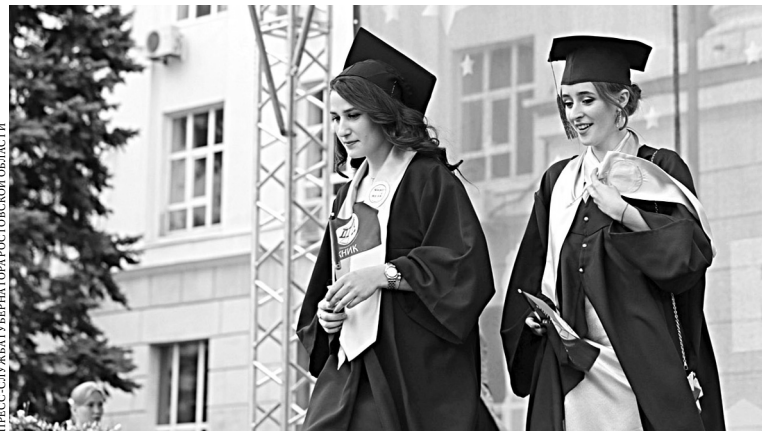
ПРЕСС-СЛУЖБА ГУБЕРНАТОРА РОСТОВСКОЙ ОБЛАСТИ

Ежегодно в регионе более шести тысяч молодых людей оканчивают высшие учебные заведения на отлично.