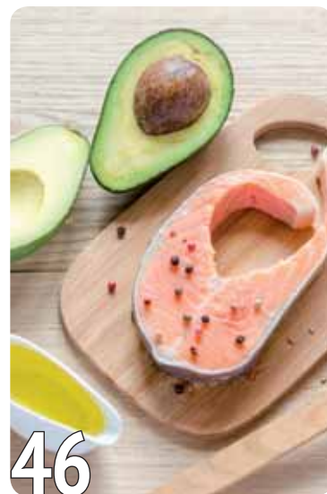
Лекарство от природы