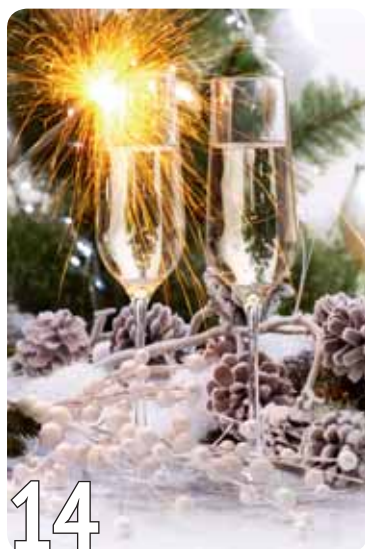
Новый год без лишних килограммов