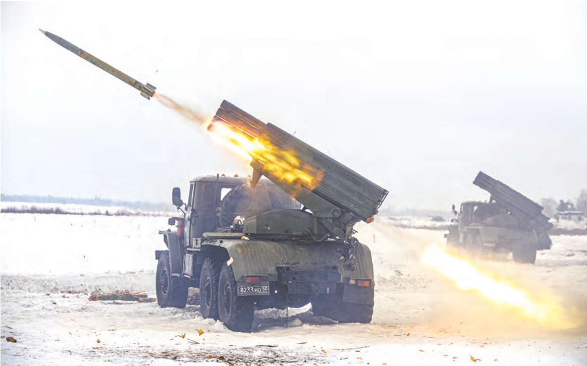
Совместные действия российских и белорусских военнослужащих поддерживают огнём «Грады»

Кстати, условия мировой пандемии нового коронавируса наложили и на эту рутинную, на первый взгляд, процедуру свои особенности: российская сторона перед передачей провела тщательную дезинфекцию передаваемой белорусским