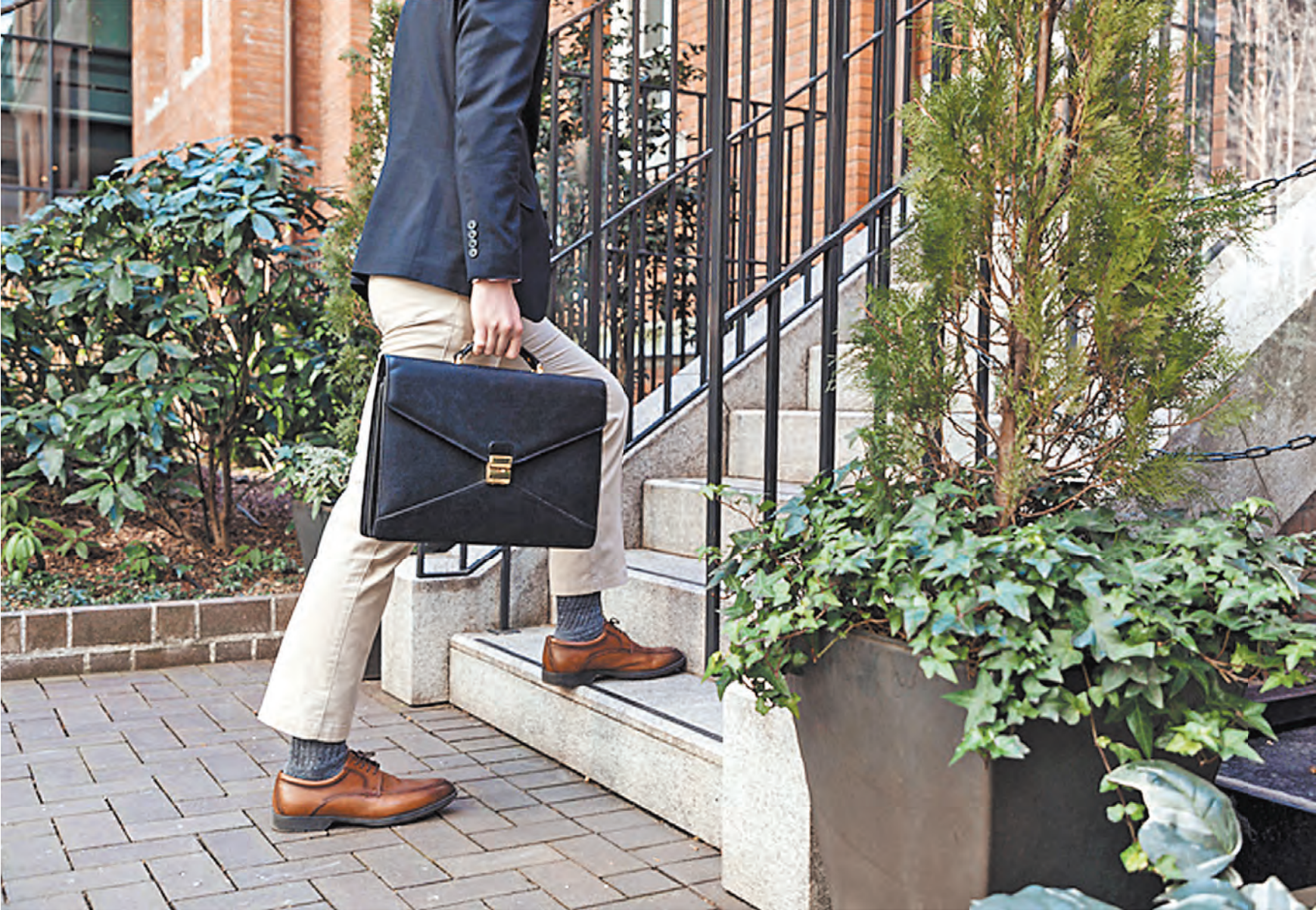
Под повышенное налогообложение, очевидно, попадают топ-менеджеры, управленцы, владельцы бизнеса.

Эти деньги будут направлены на лечение детей с редкими тяжелыми заболеваниями, в том числе закупку для них дорогих лекарств, техники, средств реабилитации, проведение высокотехнологичных операций. Планируемые сборы сравнимы с суммами, которые выделяются из бюджета на закупку лекарств для людей с орфанными заболеваниями. Средства от по-