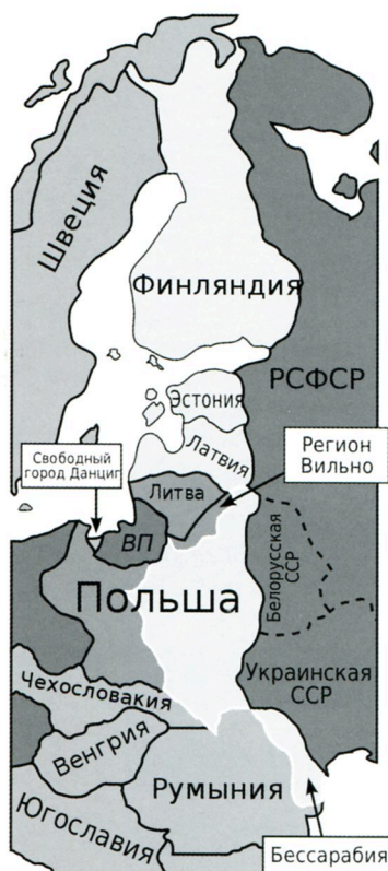
Планируемое разделение Центральной Европы по пакту Молотова — Риббентропа