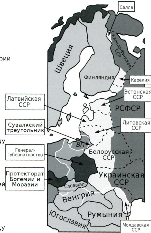
Действительные территориальные изменения в 1939 — 1940