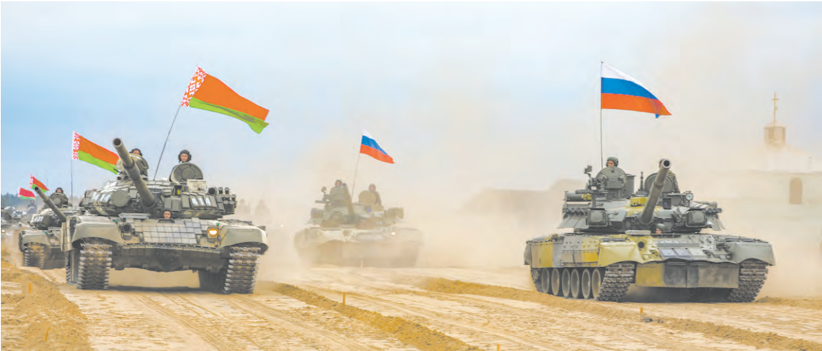
Российские и белорусские воины в едином строю защитников Союзного государства

– Когда началась и как проводилась подготовка к манёврам? – Западный военный округ начал подготовку к ССУ «Запад-2021»