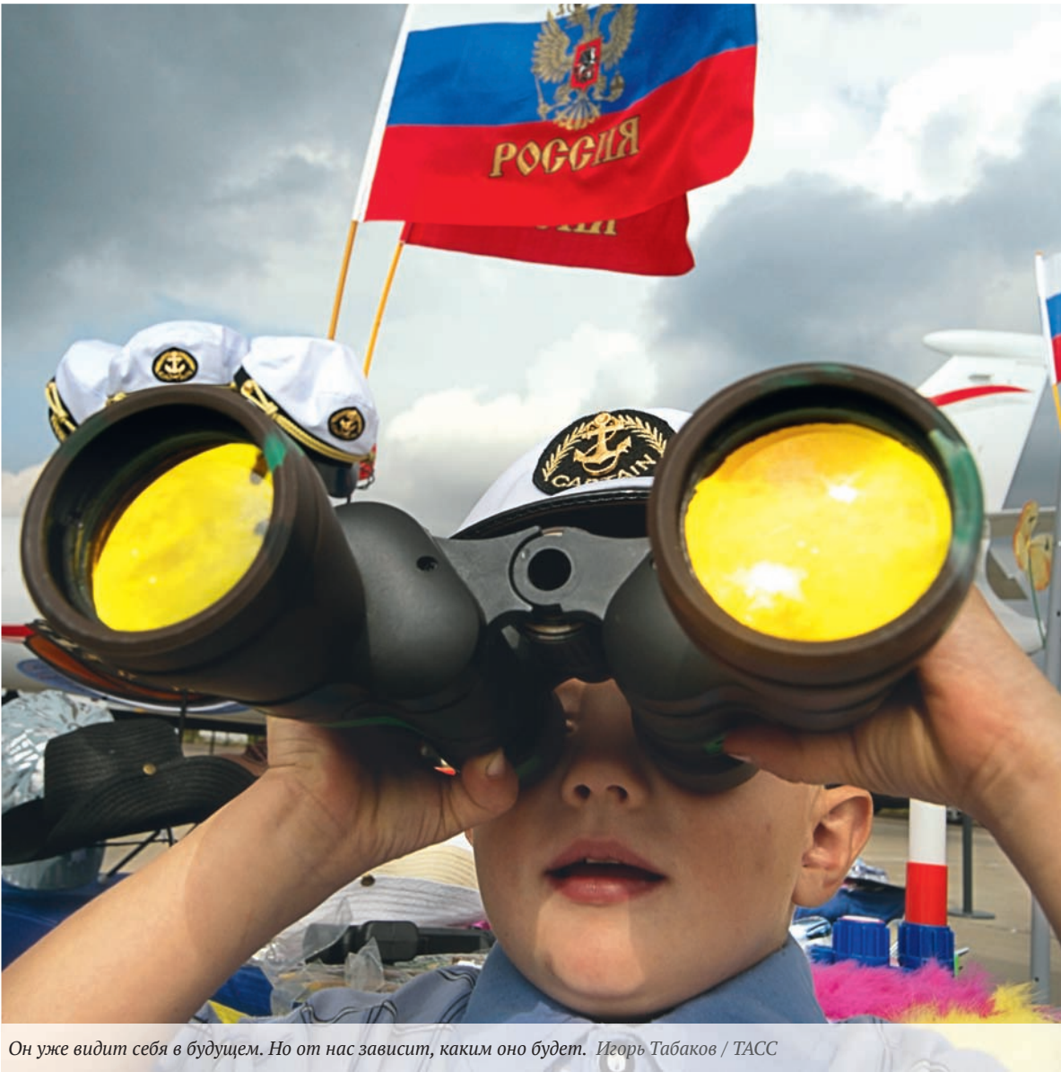
Он уже видит себя в будущем. Но от нас зависит, каким оно будет.

Минстрой подготовил поправки к закону о долевом строительстве (Закон № 214-ФЗ), согласно которым в случае банкротства застройщика покупателям квартир будет компенсирована сумма, эквивалентная стоимости до 100 квадратных метров.