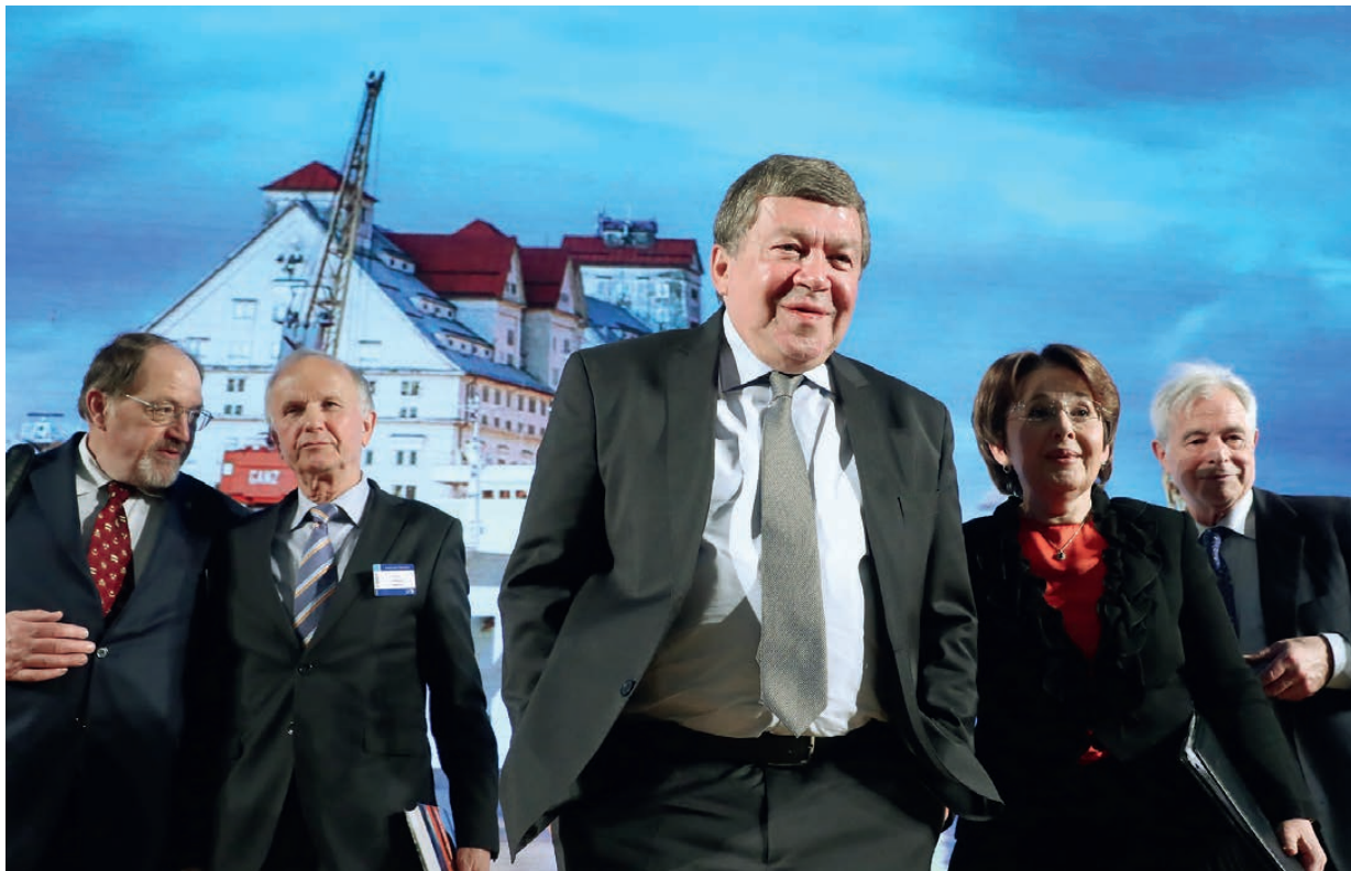
Участники форума видят экономические перспективы России совершенно иначе, нежели правительство.

Саудовская Аравия совместно с японской телекоммуникационной корпорацией Softbank построит крупнейшую в мире солнечную ферму мощностью 200 ГВт. Проект электростанции предусматривает создание 100 тыс. рабочих мест, его реализация позволит увеличить ВВП королевства на $40 млрд в год.