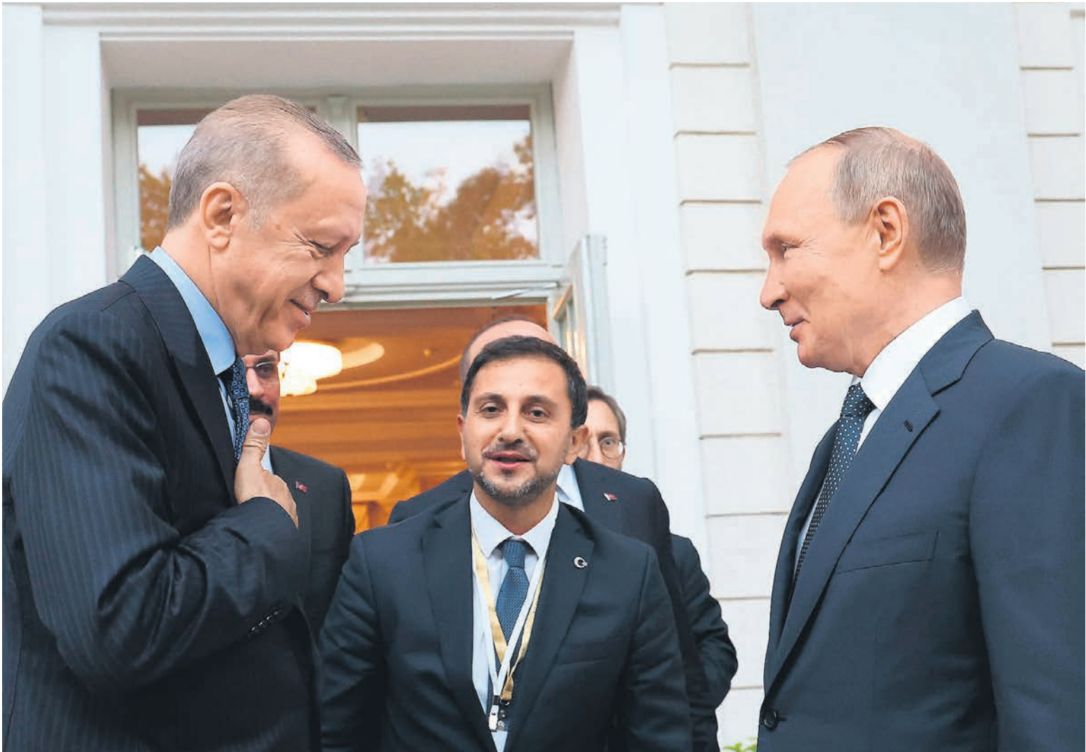
Расстались друзьями

На самом деле мог и похлопать, хотя бы когда встретились. Но они лишь поздоровались за руку, и это выглядело даже вызывающе, если бы не знать то, что знает „Ъ“: была договоренность о том, что президент Турции хоть и не сдает анализы по прибытии в Сочи, но хотя бы видимость дистанции держит (не дышит на коллегу на свежем воздухе).