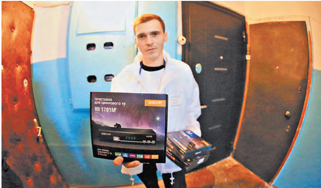
Минпромторг обещает: дефицита цифровых приставок не будет.

ФАС провела анализ изменения цен на ТВ-приставки с июня по декабрь 2018 года. Мониторинг служба ведет по поручению правительств. Пристальное внимание к этой теме связано как раз с переходом с аналогово-