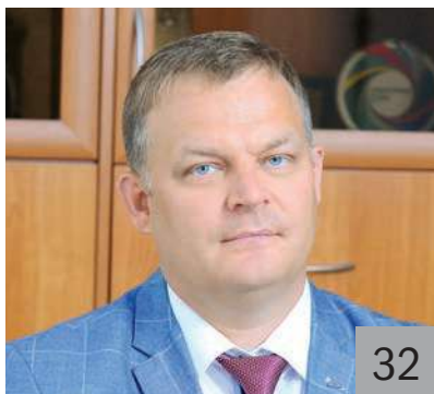
Е. В. СЕНЬЧЕВ, министр финансов Оренбургской области