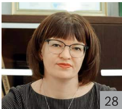
Т. С. МИТРОФАНОВА, министр финансов Амурской области