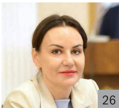
Н. Г. БРЮХАНОВА, министр финансов Ульяновской области

23 М. С. МИХАЙЛОВА. Бюджетное законодательство РФ: новые подходы Основные подходы к формированию бюджетной политики и межбюджетных отношений в Российской Федерации в 2024–2026 годах.