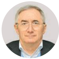
В. Д. Дзгоев

Министр Правительства Москвы, начальник Главного контрольного управления города Москвы