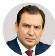
Е. А. Данчиков

Министр Правительства Москвы, начальник Главного контрольного управления города Москвы