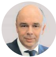
А. Г. Силуанов

Ректор Финансового университета при Правительстве РФ