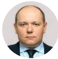
В. А. Зеленский

Первый заместитель председателя Государственной думы