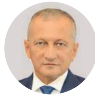
З. А. Исаев

Первый заместитель министра здравоохранения РФ