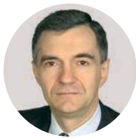
А. В. Юрин

Президент Финансового университета при Правительстве РФ