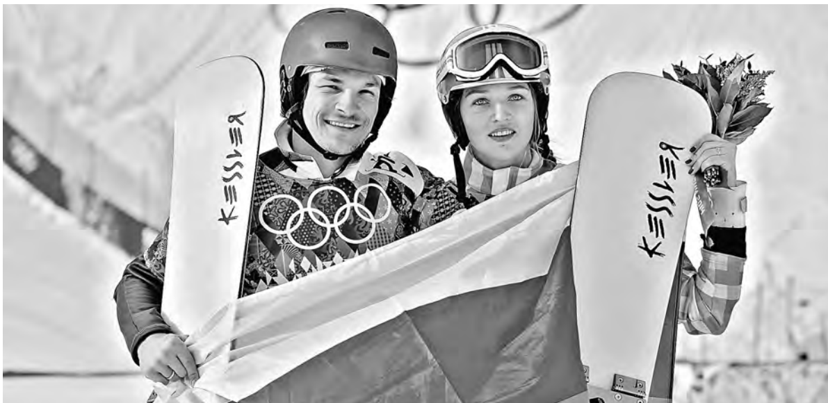
Вик Уайлд и Алена Заварзина гуляли свадьбу три дня. Интересно, сколько они будут «обмывать» свои олимпийские медали?