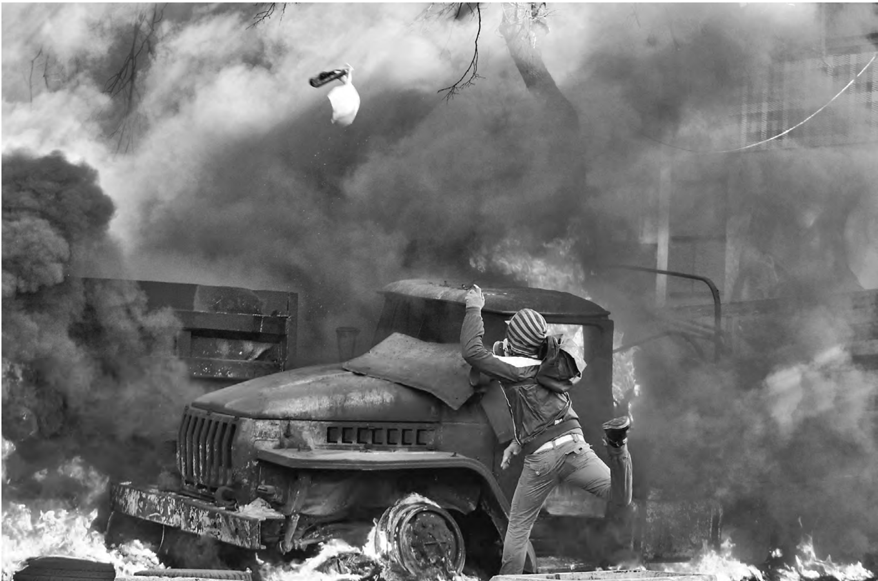
Более 350 человек обратились за помощью в больницы и медпункты Киева. Ответственность за кровопролитие в столице Украины несет оппозиция.