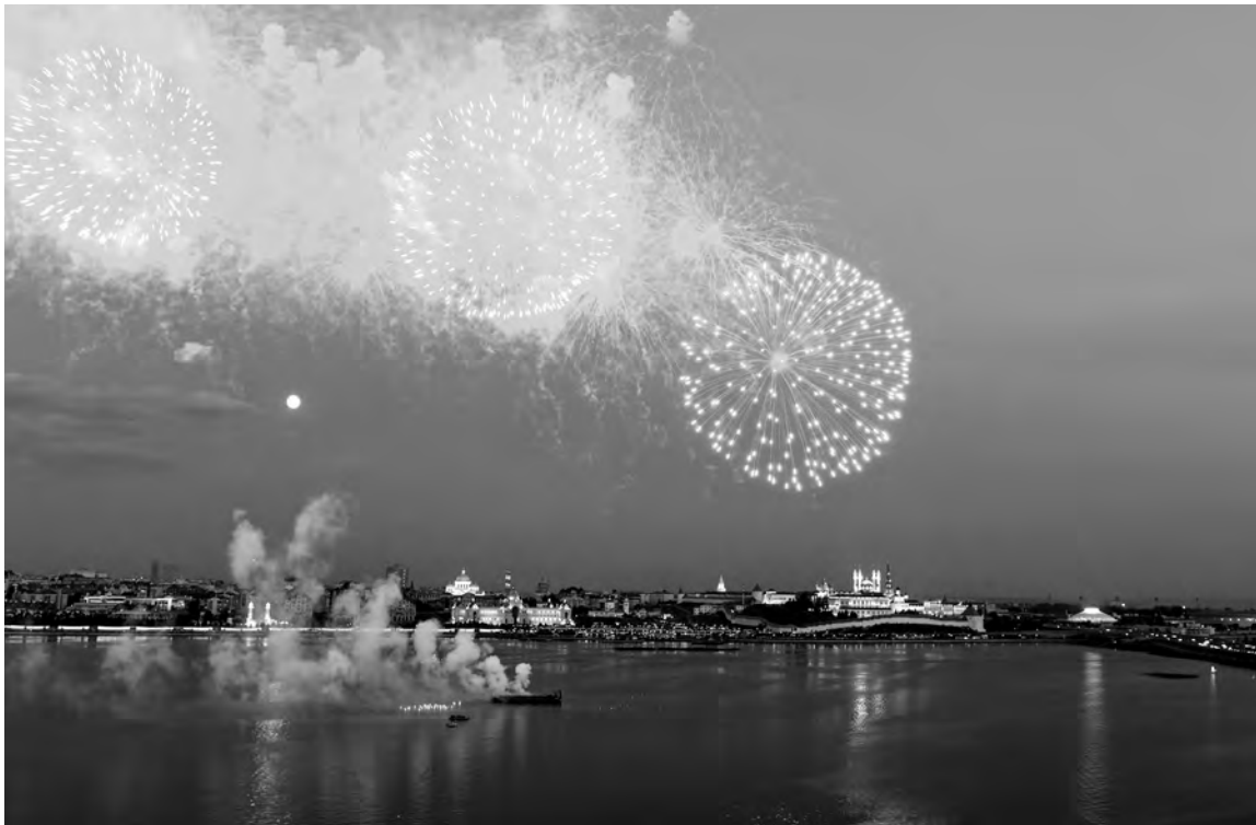
ПРЕСС-СЛУЖБА МЭРИИ КАЗАНИ

ПРОВЕСТИ акцию в честь 75-летия Великой Победы помогут волонтеры, о наборе которых уже объявил Ресурсный центр поддержки добровольчества РМЭ. Они будут сопровождать участников шествия, которые пройдут по улицам города в шеренгах по 12 человек. Кроме того, в их задачи входит информирование граждан о маршруте «Бессмертного полка» и времени движения колонны, а также обеспечение порядка и безопасности.