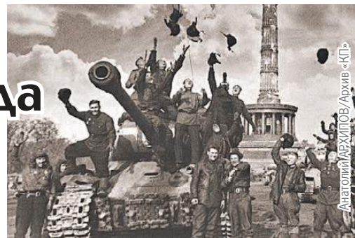
Анатолий АРХИПОВ/Архив «КП»