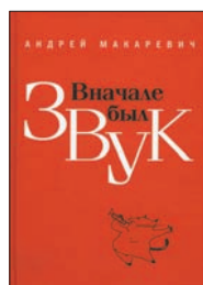
Макаревич А. Вначале был звук: Маленькие ИСТОРИИ М.: Эксмо, 2010. — 256 с.

6 Грамотно употреблять еду и горячительные напитки под авторитетным руководством Андрея Макаревича мы уже научились. А «Вначале был звук» дает прекрасную возможность поизучать в его приятной компании нотную грамоту, интересные особенности музыкальных инструментов... да и просто лишний раз проникнуться величием Битлов.