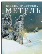
Сорокин В. Метель. М.: АСТ, Астрель, Харвест, 2010. — 304 с.