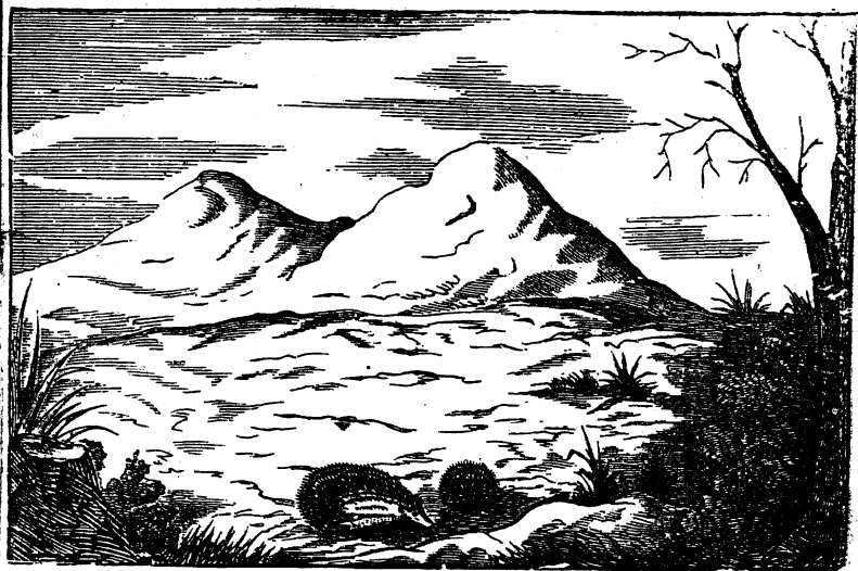
Е. е Ежъ.