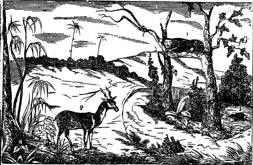
Д. д. Дикая кошка и серна.