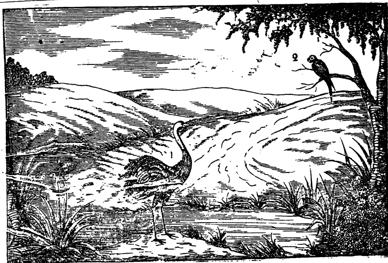
А. а. Аистъ.