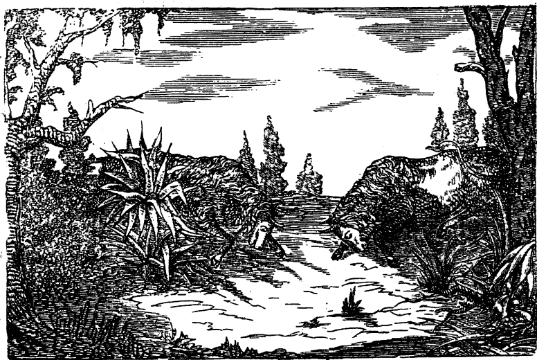
Б. б. Бизоны. А