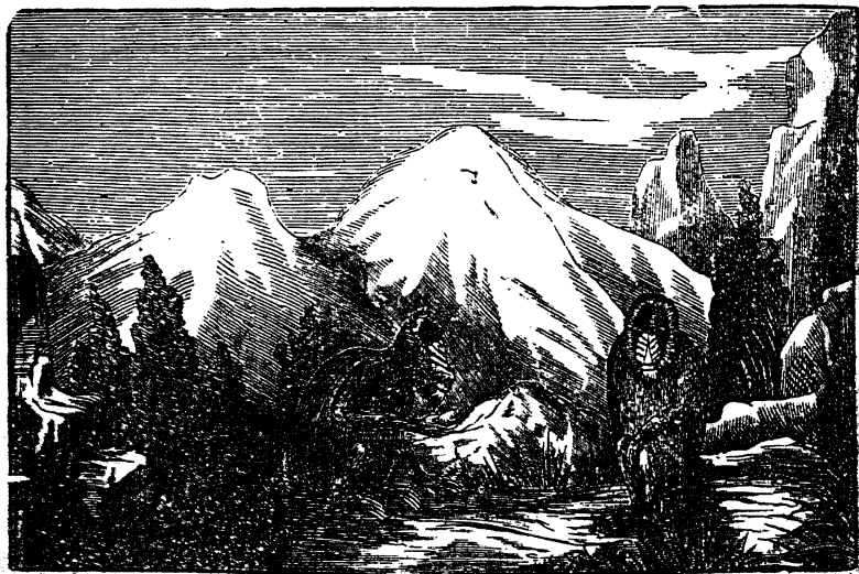
Г. г. Горилла.