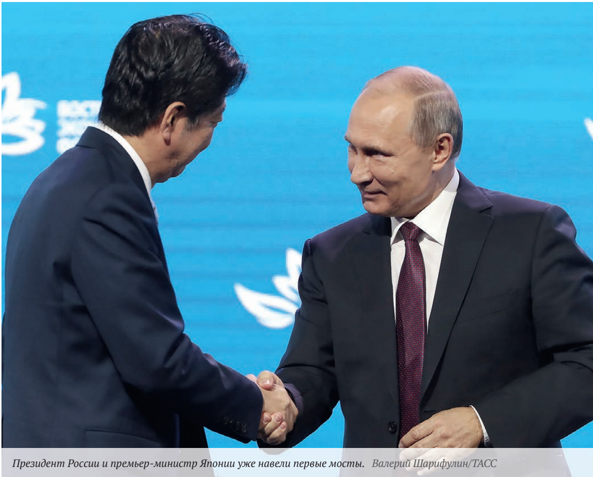
Президент России и премьер-министр Японии уже навели первые мосты.

Целый ряд аналитиков предполагает, что совет директоров ЦБ на заседании, которое состоится 15 сентября, будет обсуждать снижение ставки на 25 или 50 базисных пунктов.