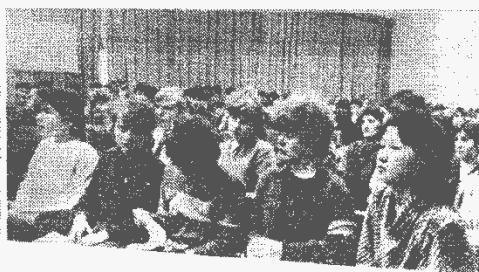
▲ На встрече работников правоохраны с трудовым коллективом.