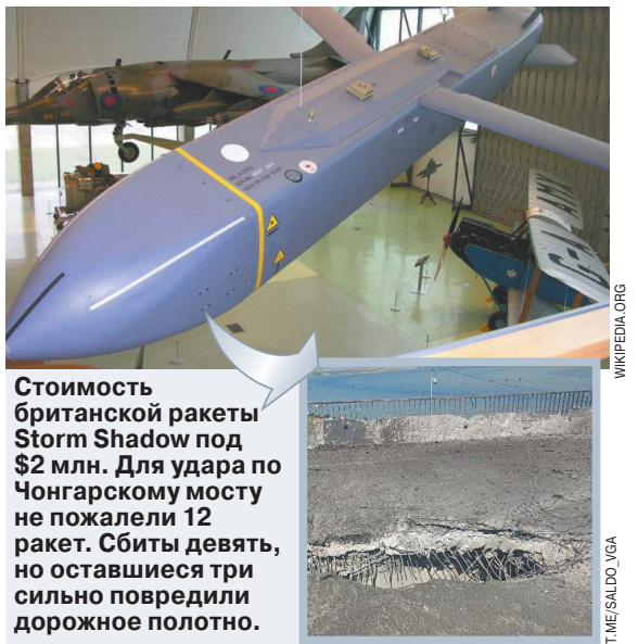
Стоимость британской ракеты Storm Shadow под $2 млн. Для удара по Чонгарскому мосту не пожалели 12 ракет. Сбиты девять, но оставшиеся три сильно повредили дорожное полотно.