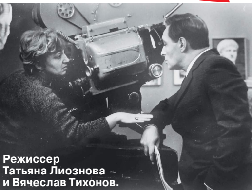
Режиссер Татьяна Лиознова и Вячеслав Тихонов.