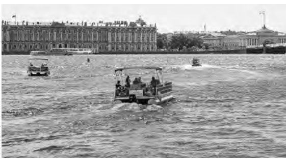
Переправа действует уже второй год.

В Петербурге возобновили работу паромной переправы, которая выполняет функции дублера Биржевого моста. Пассажиров доставляют от причала на Адмиралтейской набережной к Петропавловской крепости и обратно. На маршруте курсируют тримараны, рассчитанные на 11 пассажиров. Водные суда подходят к причалам каждые 10 минут. Время поездки 7 минут.