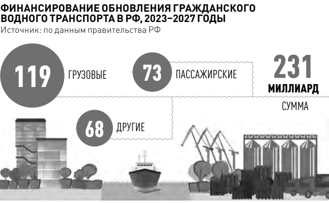
ИНФОГРАФИКА: РГ. / СВЕТАНА ЦЫГАНКОВА / АНА ДУРОВА

22740 М. Предварительно спуск на воду запланирован на 2025 год. Эти суда станут использоваться в период навигации в Балтийском, Белом, Азовском и Каспийском морях, на внутренних водных путях, а также при необходимости в других морских бассейнах. В Череповце на новом судостроительном заводе, который запустили благодаря действию специального льготного налогового режима, строят баржи. На них можно перевозить сыпучие грузы. Судну присвоен класс «О», что позволяет проходить по всем рекам и озерам. Баржа сделана из отечественных материалов и комплектующих. К стати, как раз из-за небольшой грузоподъемности баржа и способна пройти весь Волго-Балтийский канал и принимать груз с любых причалов, даже необорудованных. В этом ее уникальность. Она будет просто незаменима для тех, кто транспортирует ограниченные партии груза. Каждую такую партию сначала определяют на отдельную баржу, потом их объединяют в составы, пока примерно до восьми барж. А потом, возможно, и больше.