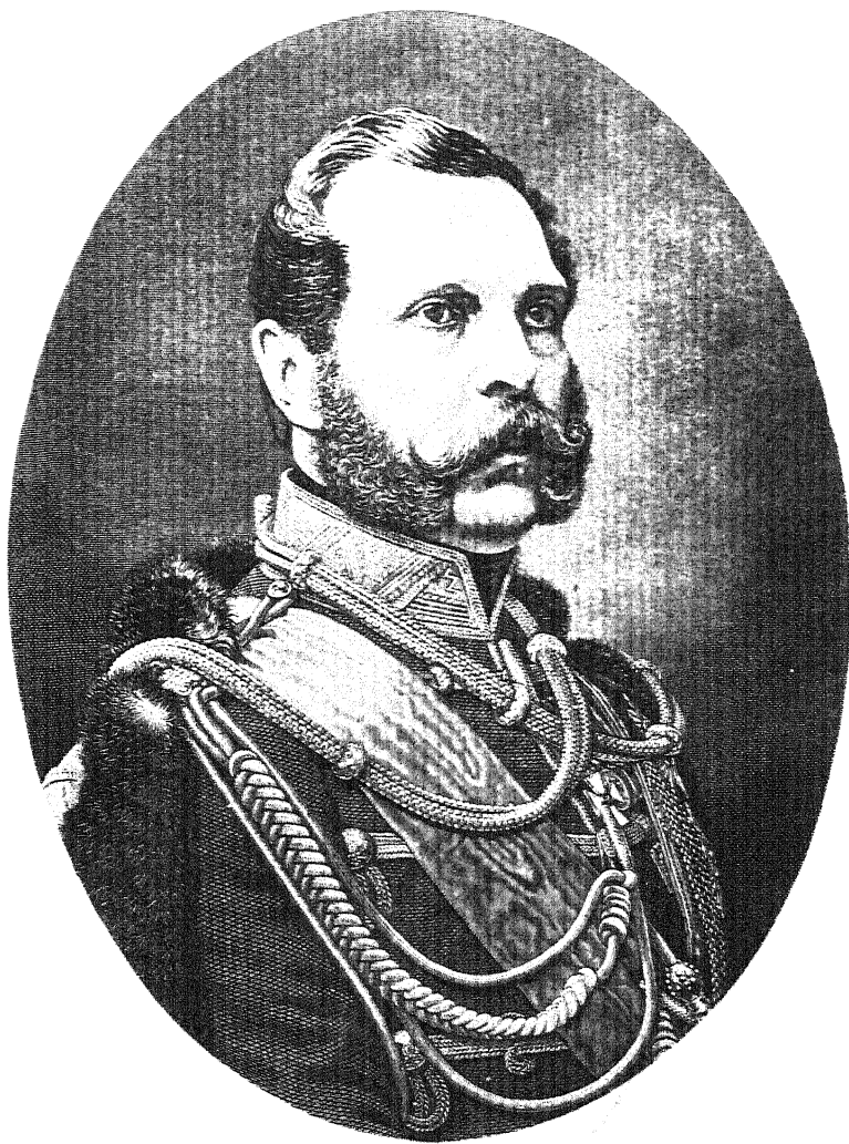
Императоръ Александръ Николаевичъ.