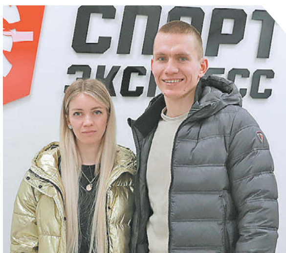
Александр Федоров «СЗ» / Canon EOS-1DX Mark II