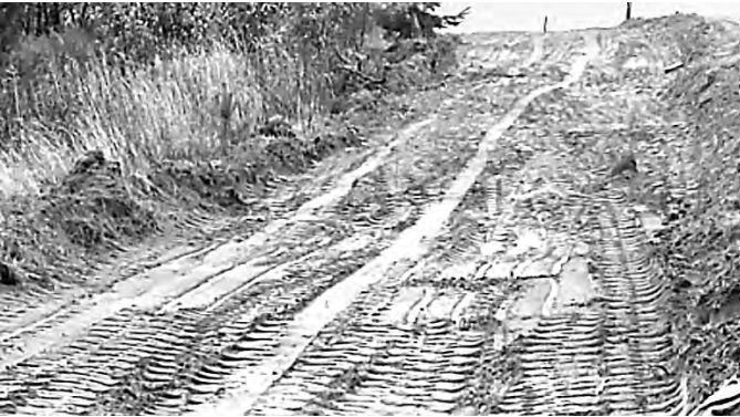
Осенью по грунтовой дороге даже на внедорожнике подняться трудно.

— Строительные нормативы разрешают производить работы по устройству щебеночных покрытий дорог даже при отрицательной температуре. Однако требования ГОСТ по хранению материала в условиях, предохраняющих его от засорения и загрязнения, подрядная организация нарушила. Известняковый щебень, брошенный у дороги, размывает от дождей. Кроме того, бесхозный стройматериал уже начали растаскивать неизвестные.