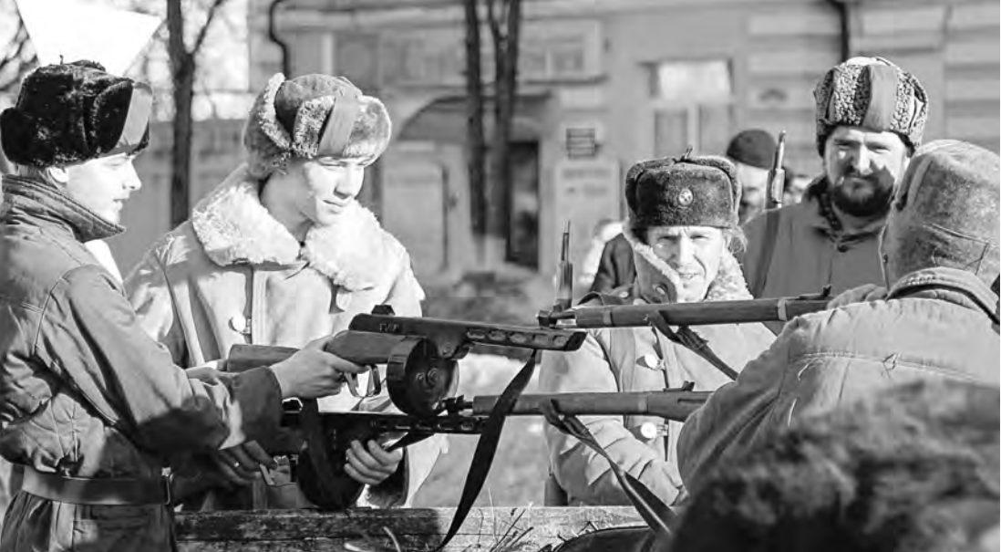
В Старой Руссе Новгородской области прошли торжества, посвященные 75-летию освобождения города от фашистских захватчиков. В оккупации он находился 923 дня. Одним из главных событий стало театрализованное шествие: реконструкторы в форме военных лет напомнили и о боях, сражавшихся на озере Ильмень, и о лыжных бригадах, и о партизанских отрядах.

ИМЕЮЩИЕСЯ два моста через реку Вологду в центре города не справляются с транспортной нагрузкой в часы пик. Поэтому региональные власти приняли решение о возведении еще одного — в створе улицы Некрасова. Как сообщает губернатор Вологодской области Олег Кувшинников, предполагается, что работы начнутся в 2020 году. Затем планируется строительство еще одного моста — в створе Флотского переуллка.