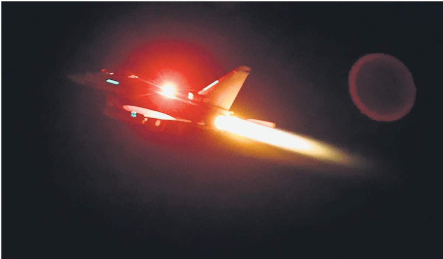
Удары США и их союзников (на фото: задействованный в операции истребитель Eurofighter Typhoon) по инфраструктуре хуситов еще больше повысили градус напряженности на Ближнем Востоке

В свою очередь, пресс-секретарь «Ансар Аллах» Яхья Сариа заявил, что в результате атаки американской коалиции погибли пять человек, а ранены еще шесть. При этом он подчеркнул, что авиаудары не остановят хуситов: атаки на связан-