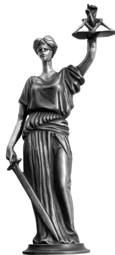
Серия «Классика российской цивилистики» — лауреат высшей юридической премии «Фемида»

Внимание! Дополнительный бонус при покупке полного комплекта книг (50 и более томов) – годовая подписка на журнал «Вестник гражданского права».