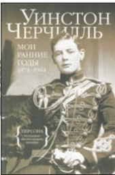
Черчилль У. Мои ранние годы / Пер. с англ. Е.Осеновой. М.: Колибри, Азбука-Аттикус, 2011. — 368 с.

1 «Школьные годы чудесные» вспоминает самый знаменитый англичанин. А также свои журналистские подвиги во время Англо-бурской войны, плен и побег, первые шаги в политике... «Я обеими руками за школы, но не хочу пойти туда...» — лишь малое, что можно процитировать из этой книги.