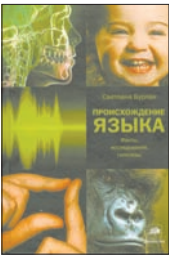
Бурлак С. Происхождение языка: Факты, исследования, гипотезы. М.: Астрель, CORPUS, 2011. — 464 с.

2 Книга начинается с того, что «проблема происхождения языка долгое время считалась неразрешимой». Это отчасти правда. Автор рассматривает эту проблему не только с точки зрения лингвистики, но и физиологии, что действительно оказывается новым подходом к теме. Если вкратце: обезьяну нельзя научить человеческой речи, чтобы ни говорили британские ученые.