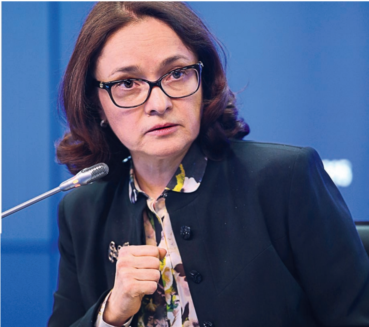
С покорением инфляции роль ЦБ и Эльвиры Набиуллиной в экономической политике не уменьшится.

К визиту Дональда Трампа в Саудовскую Аравию подготовлены соглашения между Saudi Arabian Oil Co и американскими General Electric, Schlumberger, Halliburton, Baker Hughes, Nabors Industries, Rowan Companies и Weatherford International. План Эр-Рияда состоит в том, чтобы довести долю нефтегазового оборудования собственного производства до 70% к 2021 г.