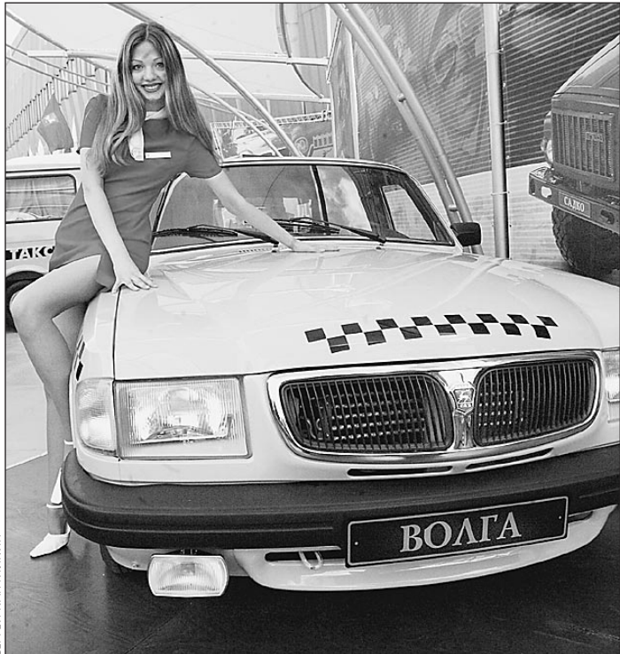
Российских «Волг» Ирак теперь не увидит

Военные действия в Ираке немедленно сказались на десятках, а то и сотнях российских предприятий. Тысячи людей лишились работы, сорваны серьезные контракты на поставку техники, оборудования, продукции. Одна только московская компания «Энергомашэкспорт — силовые машины» потеряла около 350 миллионов долларов упущенной выручки. Однако не исключено, что российскую экономику ждут от этой войны не только убытки. Например, на Кубани уже предвещают резкое увеличение числа курортников в этом сезоне, вынужденных отказаться от поездок в Турцию, а «Норильский никель» отмечает заметное повышение спроса на рынке цветных металлов, применяемых при производстве боевой техники.