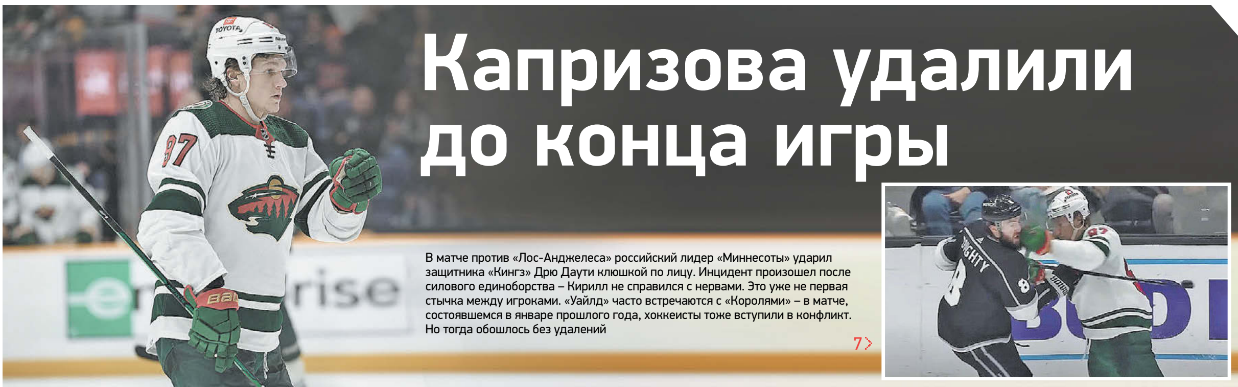
Кирилл Капризов бьет Дрю Даути