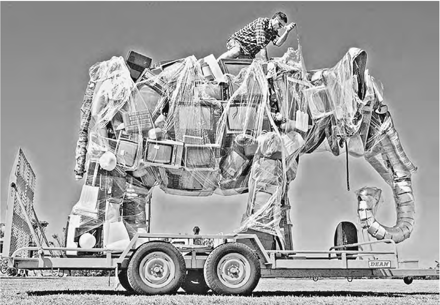
Сегодня самим везти из-за границы телевизоры, как много лет назад, уже не надо. Импорт сам приходит в наш дом.