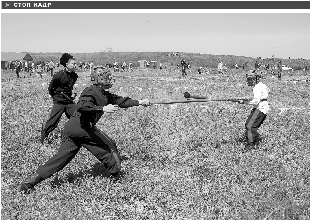
В Ростовской области состоялись традиционные игры донских казаков, шермиции. В этом году они были посвящены 380-летию взятия Азова. На территории крепости Святой Анны, в окрестностях станицы Старочеркасской, гостям праздника показали старинные казацьи воинские обряды, состязания во владении шашкой, пикой, луком, кулачные бои и борцовские поединки.

СЛЕДОВАТЕЛИ проводят проверку по факту обрушения лестничного пролета в жилом многоквартирном доме на улице Астраханской в городе Знаменске Ахтубинского района. ЧП произошло среди бела дня, по счастливой случайности, никто не пострадал. Следователи СУ СКР установили, что первоначально на лестничный пролет обрушилась бетонная плита, соединяющая жилую секцию и технический этаж. Она разрушила площадку между 4-м и 5-м этажами.