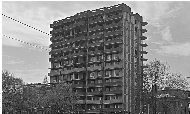
Некоторые долгострои находятся в высокой степени готовности.

А этим летом Фонд выставил на торги еще 25 участков с недостроенными многоэтажными домами в Саратове.