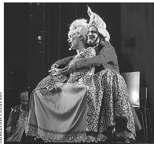
«Опасные связи» московской «Школы драматического искусства» сломали шаблоны.