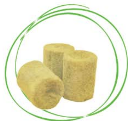
ПРОБКИ ДЛЯ СЕЯНЦЕВ ЭКОВЕР ГРУНТ