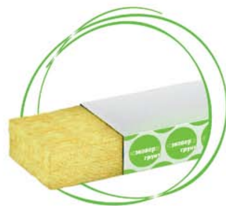
МАТЫ ВЕГЕТАЦИОННЫЕ ЭКОВЕР ГРУНТ

Продукция под маркой ЭКОВЕР ГРУНТ изготавливается из гидрофильной минеральной ваты на основе горных пород базальтовой группы, имеет все необходимые сертификаты и протоколы испытаний на применение в качестве субстрата для выращивания растений. Маты, кубики, пробки ЭКОВЕР ГРУНТ были успешно испытаны в крупнейших тепличных хозяйствах и получили положительные заключения.