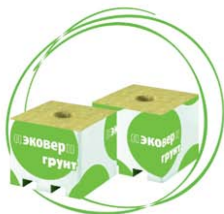
КУБИКИ ДЛЯ РАССАДЫ ЭКОВЕР ГРУНТ