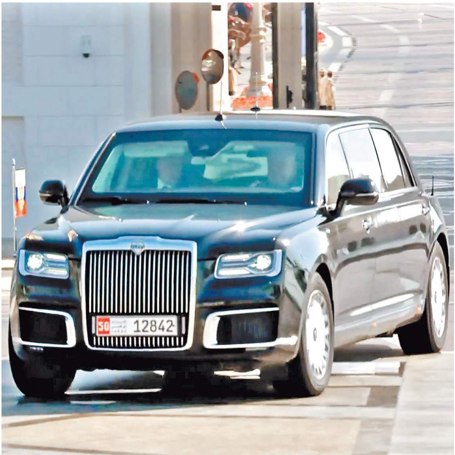
По Абу-Даби Владимир Путин передвигался на «Аурусе» с местными номерами. А небо над столицей ОАЭ по случаю визита окрасили в цвета российского флага.