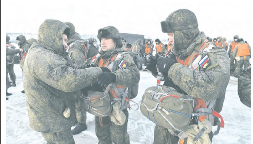
Подгонка парашютов - обязательный элемент наземных занятий по воздушно-десантной подготовке.

«Белые медведи» готовятся к первому прыжку с парашютом