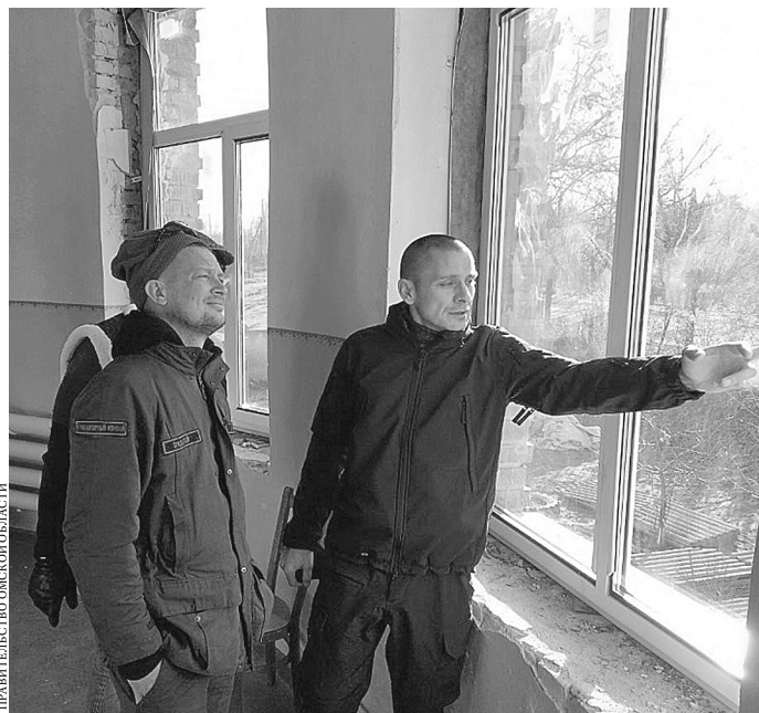
ПРАВИТЕЛЬСТВО ОМСКОЙ ОБЛАСТИ

— Все работы проводим с соблюдением требований российских государственных стандартов, что называется, под ключ. Для ускорения темпов подключаем дополнитель-