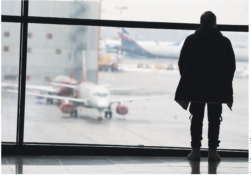
Андрей Зырянов / Известия