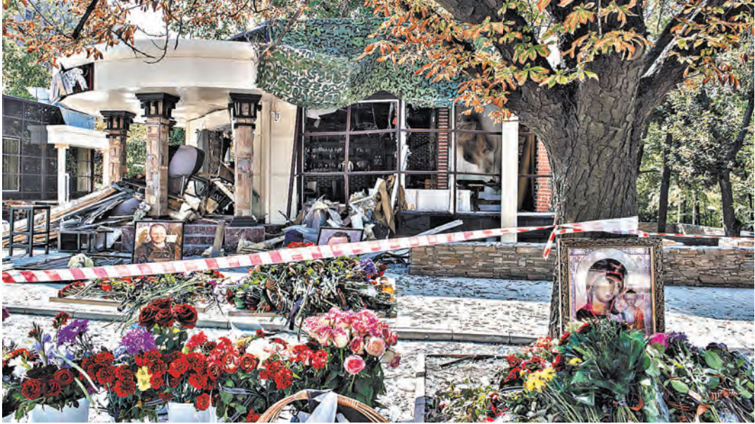
Жители Донбасса, а также представители России, Луганской народной республики, Абхазии и Южной Осетии принесли цветы и иконы к месту теракта.

ДОКУМЕНТЫ Что изменится в повседневной жизни россиян с началом осени