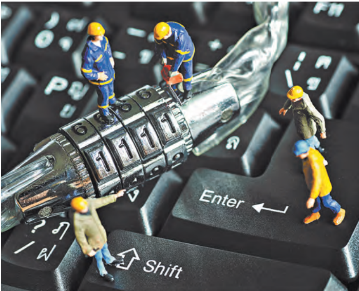
Блокировку платежа может вызвать и необычная манера нажатия клавиш.

Как рассказал в свое время «Российской газете» председатель Комитета Государственной Думы по государственному строительству и законодательству Павел Крашенинников, наследственный фонд — это способ управления тем имуществом, бизнесом, капиталом, которые остаются после смерти наследодателя.