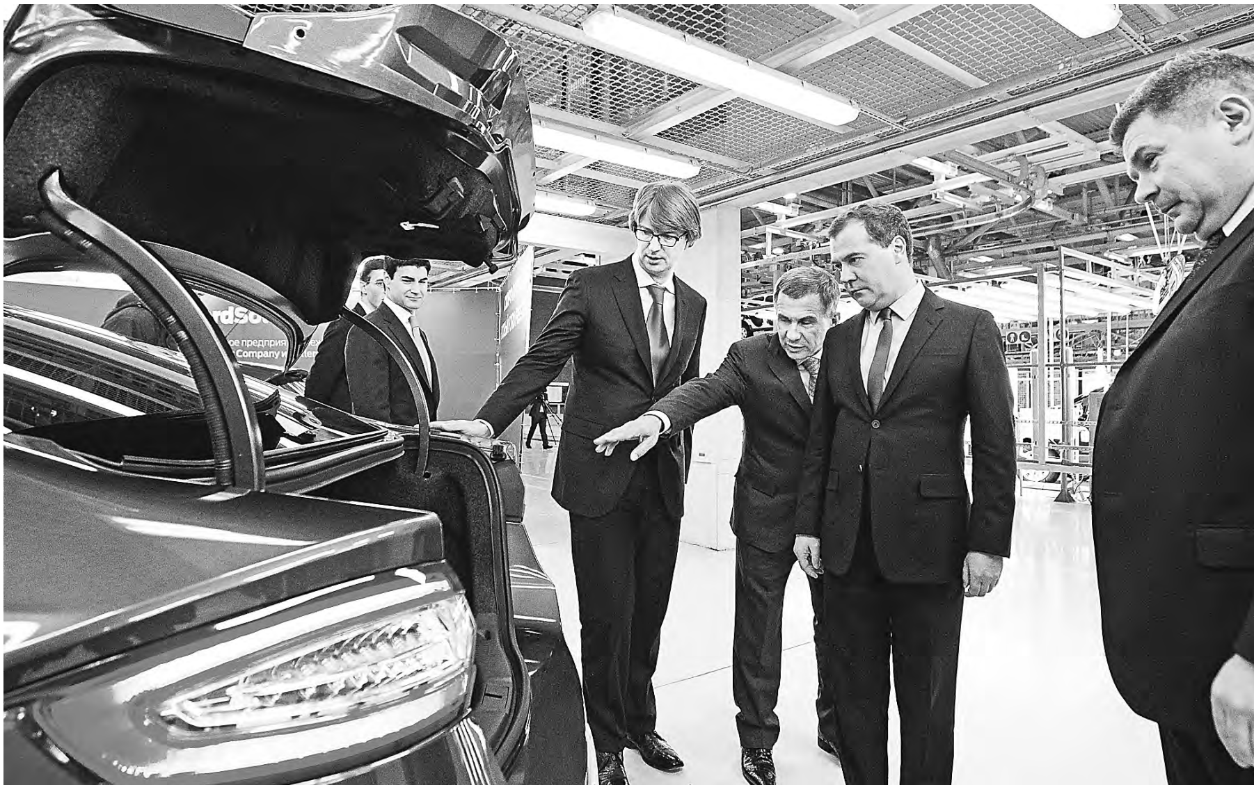
Премьер-министр Дмитрий Медведев вчера побывал в Татарстане, где принял участие в церемонии открытия завода «Ford Sollers — Набережные Челны» и запуске в серийное производство автомобилей Ford EcoSport, а также запустил новое производство топлива и масел на заводе «Татнефть».

Все материалы автора www.rg.ru/sujet/5033