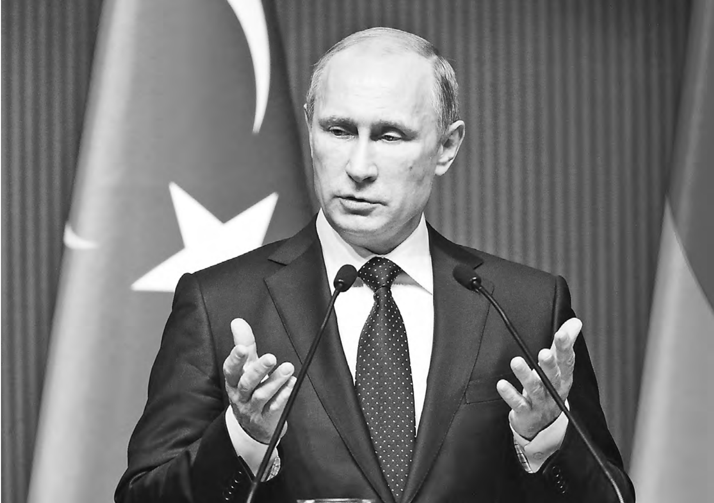
КОСТАКИН / АНКАРА

Российский лидер назвал причины, по которым «Южный поток» будет остановлен, хотя у России все было готово для реализации этого проекта. «Позиция Еврокомиссии была неконструктивной. Мы видим, что создаются препятствия. Если Европа не хочет его реализовывать, тогда он не будет реализован. Мы перенацелим наши потоки на другие регионы мира, в том числе с помощью продвижения и ускоренной реализации проектов по СПГ. Европа не получит этих объемов, по крайней мере из России. Мы считаем, что это не соответствует экономическим интересам Европы и наносит ущерб нашему сотрудничеству. Но таков выбор наших европейских друзей. Здесь ничего такого