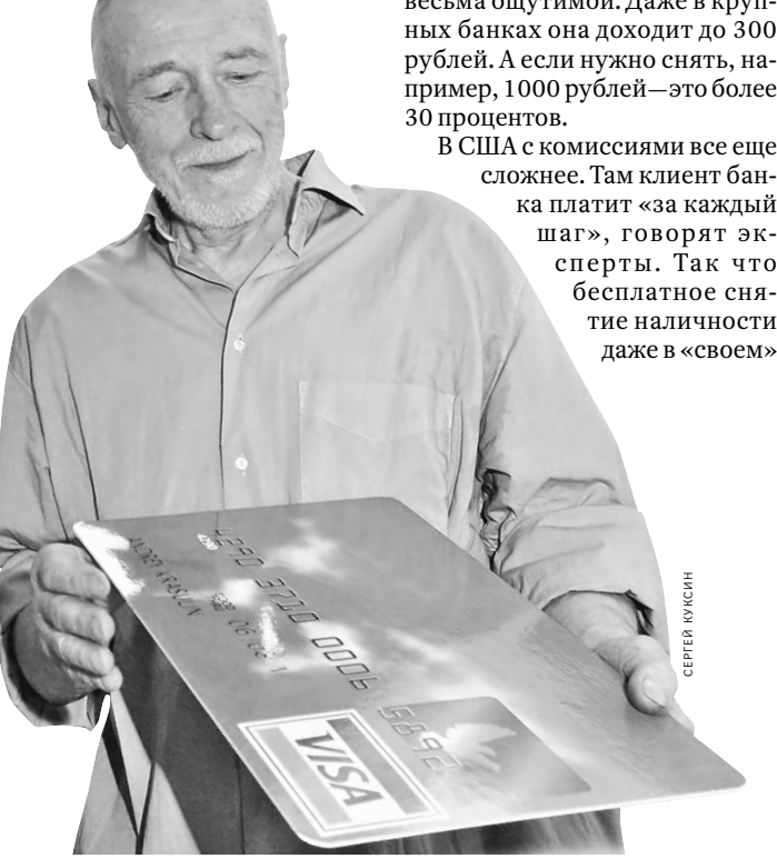
Комиссии за снятие наличных с карт огромными назвать нельзя: до 1,5 процента в «чужом» банке.

В среднем комиссия за снятие наличных в «чужом» банке, если она есть, составляет примерно 1–1,5 процента от суммы. При этом зачастую минимальная стоимость операции зафиксирована в рублях. И она бывает