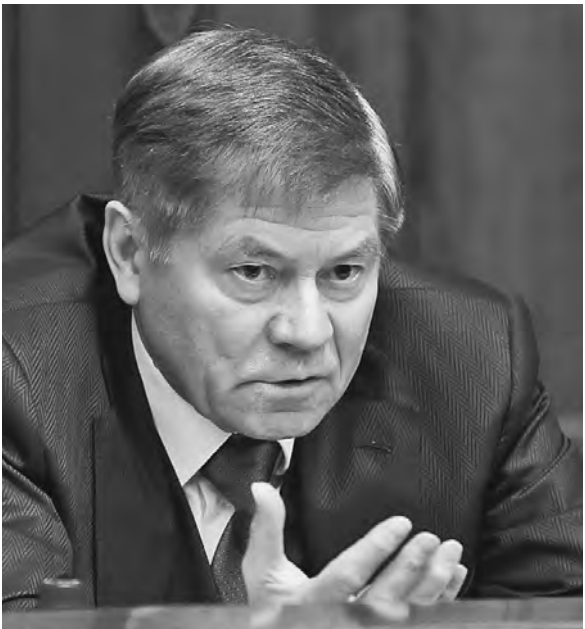
Председатель Верховного суда Вячеслав Лебедев считает, что надо расширить применение досудебных процедур.

Под значимый порядок могут попасть денежные споры. Особой сложности в них по большей части нет: если кому-то должен, то действительно надо платить. Кроме того, председатель Верховного суда считает необходимым расширить категорию гражданских дел, по которым будет обязательно соблюдение досудебной процедуры урегулирования споров. В их числе Лебедев назвал споры, связанные со страхованием, споры о детях, о разделе имущества супругов, споры, связанные с причинением вреда здоровью и имуществу, а также связанные с защитой прав потребителей.