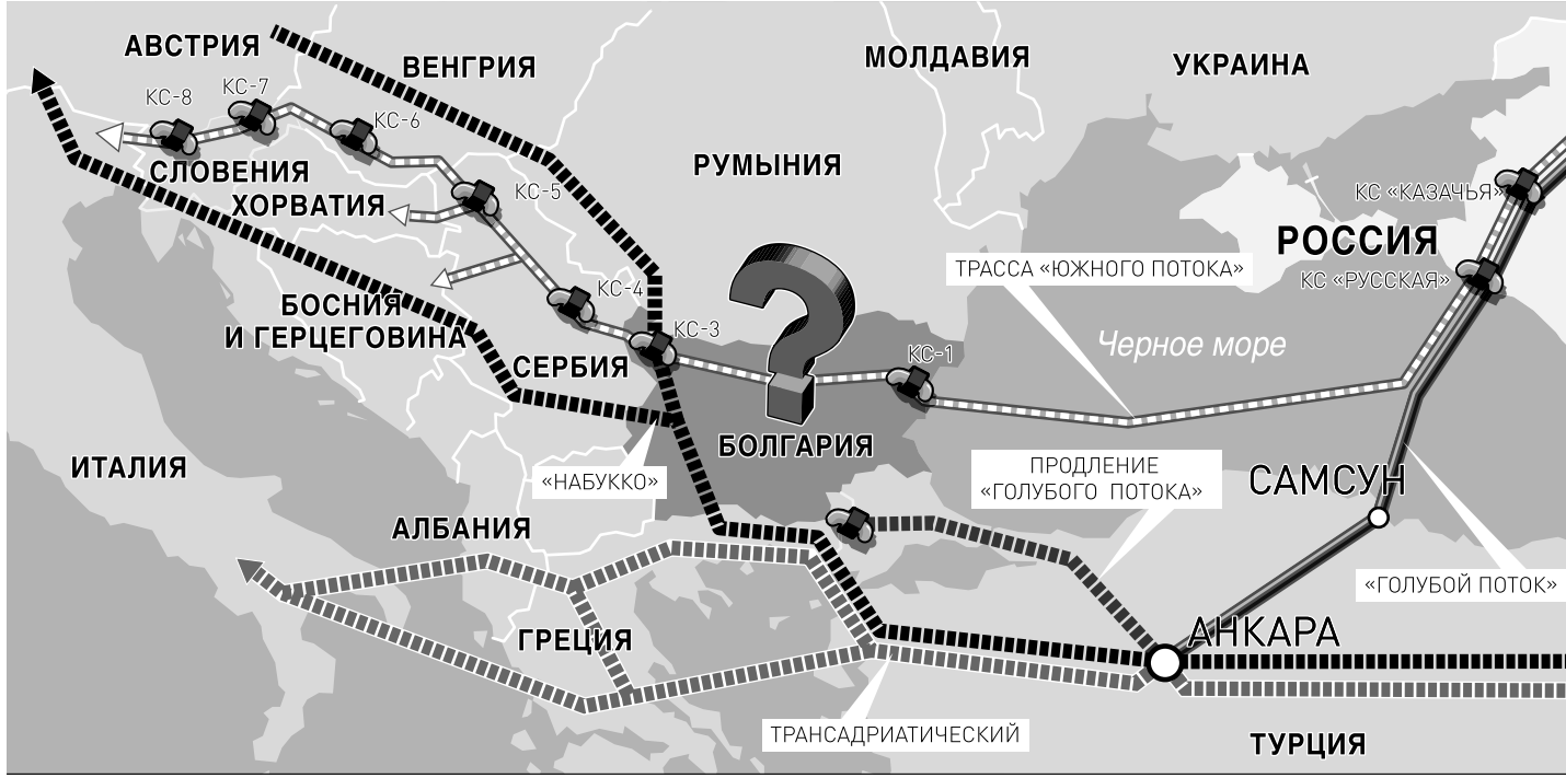
ПРОЕКТЫ ГАЗОПРОВОДОВ В ЮЖНОЙ ЕВРОПЕ