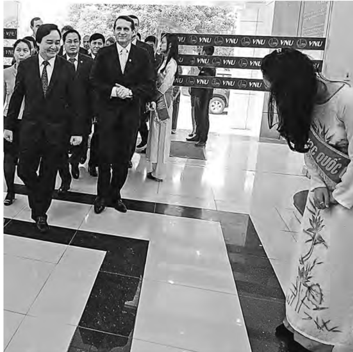
Сергей Нарышкин впервые посетил Вьетнам.

«Россия и Вьетнам занимают очень близкие позиции в ответах на вопросы, как должна быть выстроена архитектура международных отношений, как добиться того, чтобы ложь и пропаганда не заменили реальный политический процесс, а фундаментальные ценности человечества не задымались на задний план в угоду тех, кто мнит себя вершителем судеб больше чем 7 миллиардов человек, живущих на планете», — подчеркнул спикер.