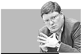
Андрей Исаев заместитель председателя Государственной Думы