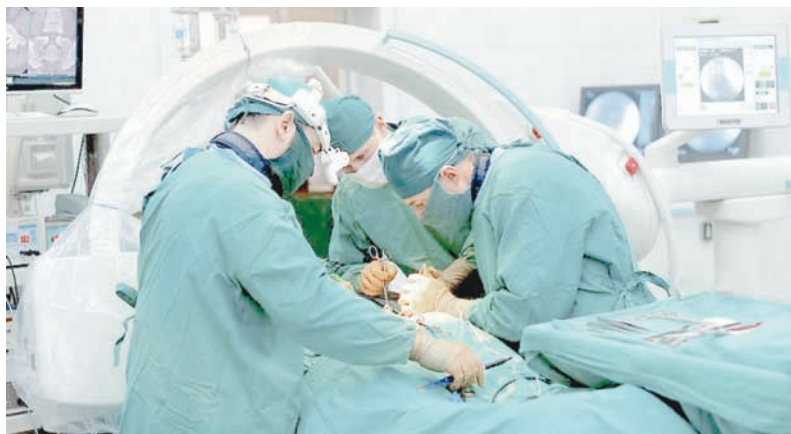
Тихо! Идёт операция.

Владимир ДАШЕВСКИЙ, фото из архива «1409 ВМГ» Минобороны России.