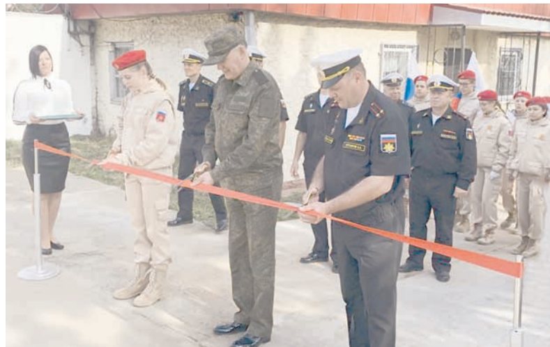
Торжественная церемония открытия парка.