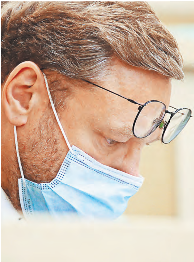
Константин Косачев: В 2020 году Россия может записать себе в несомненный актив достижение важнейшей договоренности по Нагорному Карабаху, где началась самая настоящая война.

В 2020 году санкционное и информационное давление на Россию росло. При этом наша страна оставалась дипломатом в мировых делах и показывала уверенное лидерство на фоне растущей агрессивности Запада. Остановка кровопролития в Карабахе, регистрация вакцины от COVID и защита исторической правды в год юбилея Победы — все это за нами. Об итогах и тенденциях во внешней политике в своей статье для «Российской газеты» размышляет председатель Комитета Совета Федерации по международным делам Константин Косачев.