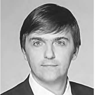
Сергей Кравцов, министр просвещения РФ:

— На соревнованиях демонстрируются высокие стандарты в области подготовки кадров по всем направлениям, исходя из потребностей бизнеса и работодателей. Наработки, которые проходят апробацию в рамках конкурсов, впоследствии находят свое место в образовательном процессе. Это в свою очередь играет важную роль в укреплении кадрового обеспечения и решении стратегических задач по развитию различных отраслей экономики.